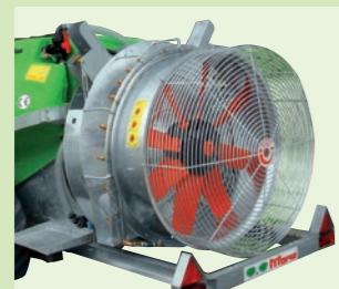
BITURBO 36" - 42"