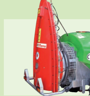
TORRE 36" - 210