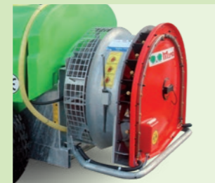
TURBOFAN AA 36"