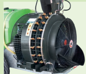
ELICA CONTROROTANTE 32" x 32"