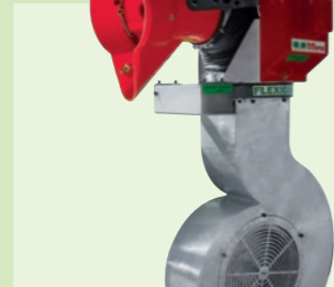
FLEXIGUN 65 S