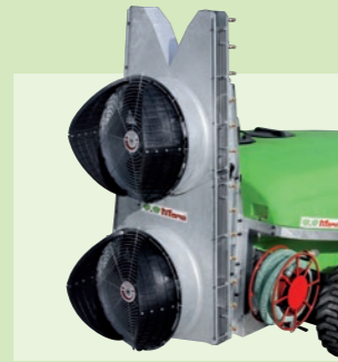
HYDRO 32" x 32"