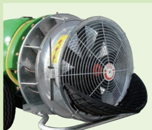
TURBOFAN 36" - 42"

La linea Vector Big monta una completa serie di apparati per ogni tipo di piantagioni e colture. Vector Big Line: available with a large range of Spray Fans and Blowers for any type of Trees Plantations and Row Crops. Die Linie Vector Big bietet eine vollständige Palette von Geräten für alle Arten von Plantagen und Anpflanzungen.