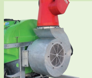
CANNONE 65 S