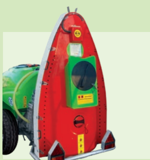
TORRE 32" - 180