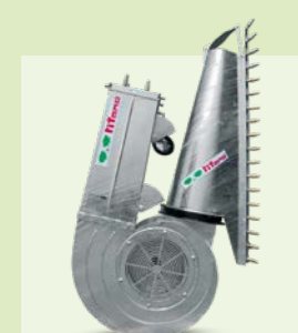
CANNONE PUNTERUOLO c/r